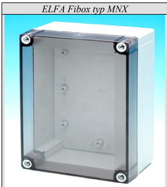
ELFA Fibox typ MNX